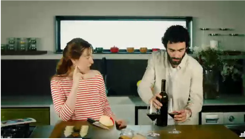
inRead invented by Teads