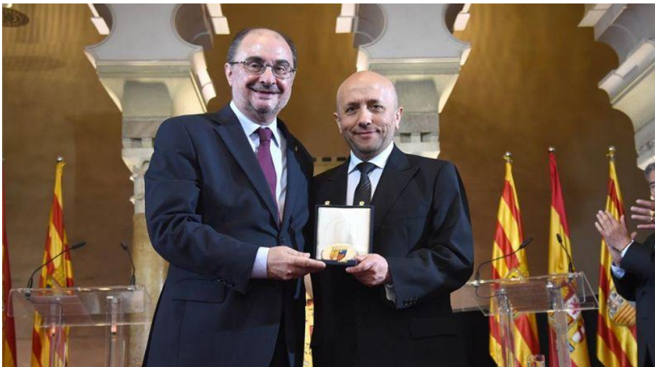
Alegre presumió de sus orígenes turolenses y de sus padres.