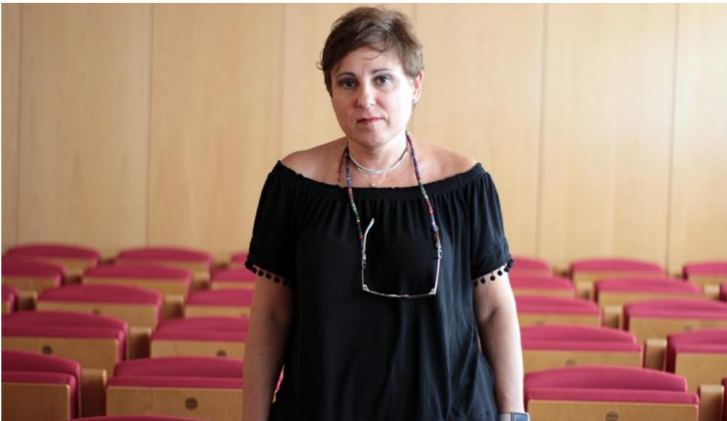
“Estamos ante una locura administrativa” -