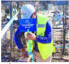
ESTÁN DEBIDAMENTE UBICADOS.